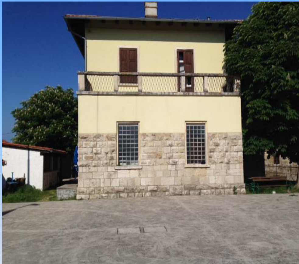
Star KD B.Jakca