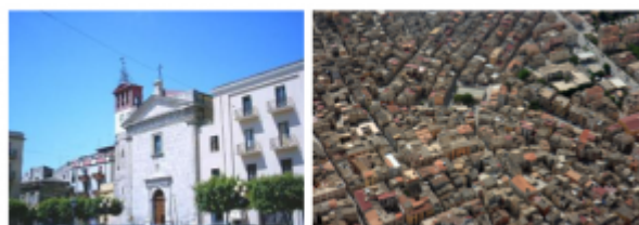
TREVICO – Kampanija jug Italije – 1000 prebivalcev