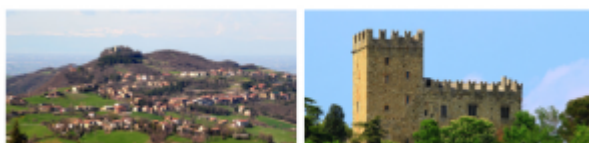
RIESI – dežela Sicilija jug Italije – 12000 prebivalcev