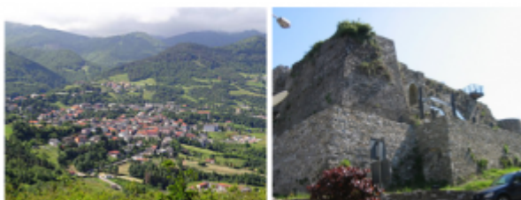
BAISO – EMILIA Romagna – sever Italije – 3500 prebivalcev