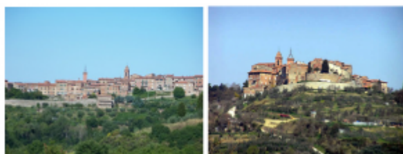
FONDACHELLI FANTINA – dežela Sicilija jug Italije – 1200 prebivalcev