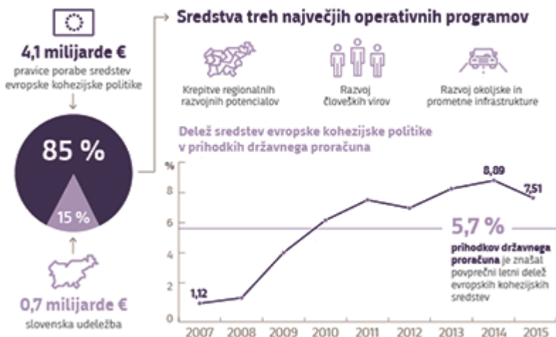
Računsko sodišče Republike Slovenije - revizijsko poročilo Upravljanje z nepravilnostmi in finančnimi popravki pri črpanju sredstev evropske kohezijske politike v Republiki Sloveniji

Čeprav se je postopek za ravnanje v primeru ugotovljenih nepravilnosti med programskim obdobjem dopolnjeval in nadgrajeval, obstoječi način spremljanja ugotovljenih nepravilnosti ne omogoča, da bi lahko enostavno in dovolj natančno ugotovili, koliko je bilo v celotnem programskem obdobju 2007–2013 odkritih nepravilnosti in izrečenih finančnih popravkov, za kolikšen delež ugotovljenih nepravilnosti so upravičenci sredstva vrnili v državni proračun in kolikšno breme bo zaradi financiranja ugotovljenih nepravilnosti nosil državni proračun.