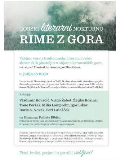
Literarni večer za pisce, bralce, gorjane in gornike