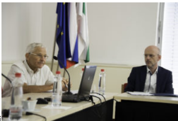
Vsebine v kulturni infrastrukturi