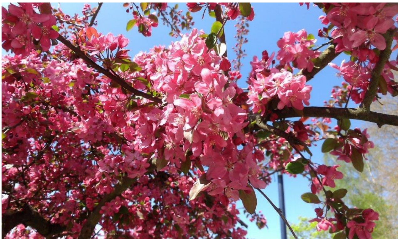
Cvetoče krošnje v mestu

V cvetočem aprilu, mesecu krajinske arhitekture, se spomnimo, kaj dobrega nam vse ponujajo drevesa v mestu. Če bo košček svoje ozaveščenosti vsak prenesel tudi v prakso, se nam za obstoj zdravnega zelenega sistema v Šoštanju ni treba bati. Tega pa bomo s krajinskimi ureditvami v bodoče še nadgradili.