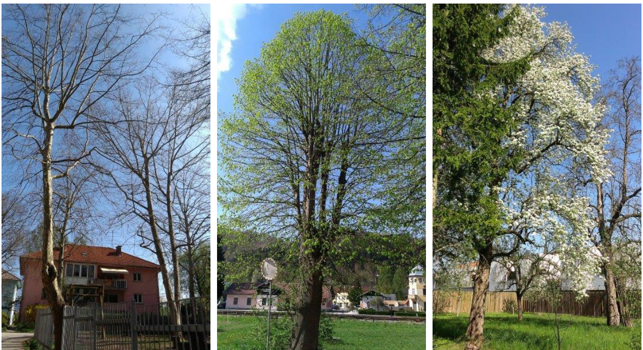
Mogočna drevesa kvalitetno urejene Cankarjeve soseske v Šoštanju

Prav v mestih, ki so zelo obremenjena s težko industrijo, je še toliko bolj pomembno, da je zeleni sistem mesta prisoten, poudarjen in tudi funkcionalen. V času nastanka teh mest so se tega zavedali in krajinsko arhitekturnim ureditvam posvečali še posebej veliko pozornosti. Lep primer take ureditve je v Šoštanju na primer soseska na Cankarjevi.