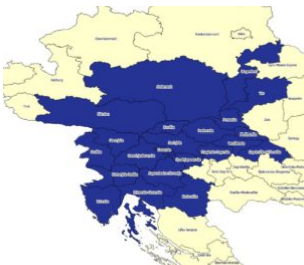
ČLANICE AAA (feb 18)

Pri vseh treh sklopih je pogoj, da so minimalno trije partnerji iz treh držav iz območij članic Zveze Alpe Jadran , partnerjev pa je lahko več, tudi iz drugih območij. Z izjemo Slovenije, katere celotno ozemlje je upravičeno, je potrebno pri sosedih (Avstrija, Hrvaška in Madž.) paziti, ker posamezne regije in niso članice AAA.